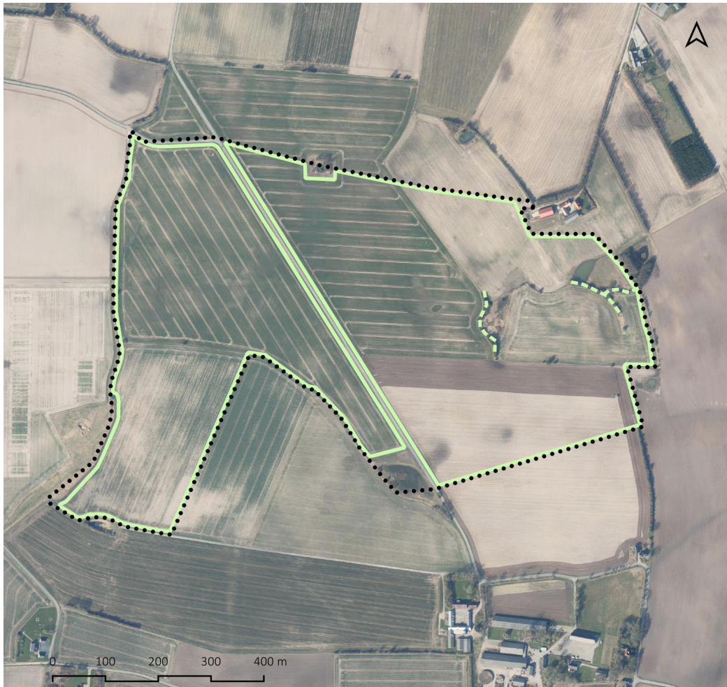
Figur 2: Princippet for ny beplantning inden for projektområdet er vist med grøn streg, mens eksisterende beplantning der bevares er vist med stiptet grøn streg. Projektområdet er vist med sort priklinje.

Beplantningen vil bestå af træer og buske, som skal sammensættes således, at det virker afskærmende i hele højden. Beplantningsbæltet vil indeholde egnstypiske hjemmehørende arter, der over tid fremstår lukket og afskærmende for indkig til anlægget. Den yderste række beplantning vil primært bestå af buske. Den eksisterende beplantning langs markskel vil blive bevaret og integreret i beplantningsbælterne. En del af den eksisterende beplantning der findes inden for projektområdet, vil blive bevaret som vist på figur 2.