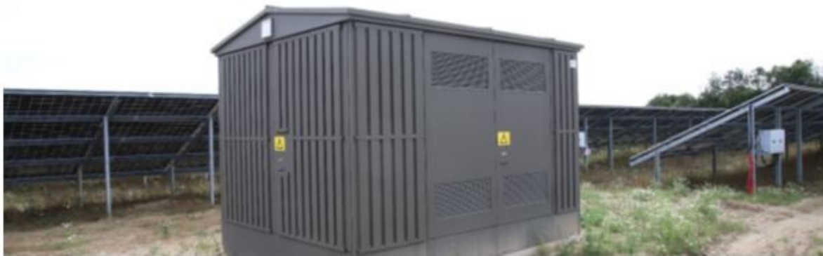
Figur 2.2: De hvide kasser under solcellerne er invertere, som omdanner jævnstrømmen til vekselstrøm og eksempel på teknikbygning, her en typisk fordelingstransformer.