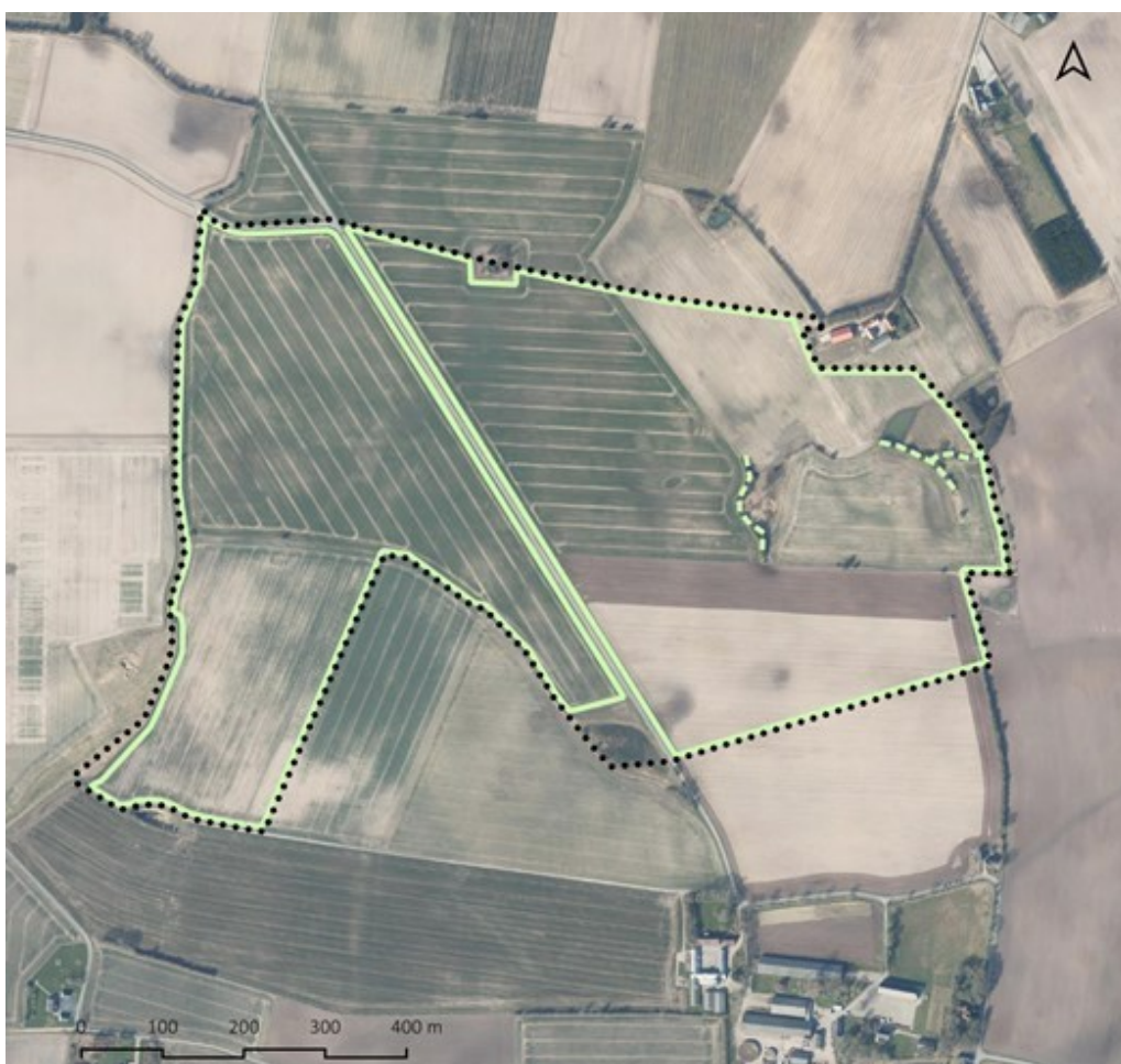
Kort 2.2: Princippet for ny beplantning inden for projektområdet er vist med grøn streg, mens eksisterende beplantning der bevares, er vist med stiplede grøn streg. Plan- og projektområdet er vist med sort priklinje.

Beplantningen etableres som et 3-rækket beplantningsbælte på minimum 5 meters bredde, og holdes i en højde på mindst 4-5 meter, så det dækker for anlægget samtidigt med, at det ikke skygger for solcellerne.