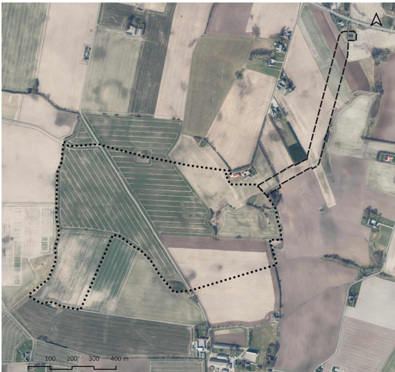
Kort 2.1: Plan- og projektområdet til solceller ved Stourup. er vist med sort priklinje. Afgrænsning af kabeltracé er vist med sort stiplet linje. Indeholder data fra Styrelsen for Dataforsyning og Effektivisering, Luftfoto, WMS-tjeneste.

Plan- og projektområdet omfatter et areal på ca. 52 hektar, der er beliggende i den nordøstlige del af Hedensted Kommune, mellem Skjold, Brund, Glud og Stourup med 200-400 meter til Stourups nordlige afgrænsning. Plan- og projektområdet ligger i det åbne land og er omkranset af dyrkede marker på alle sider. Området opdeles af offentlig vej – Skolevej. Det samlede solcelleanlæg skal tilsluttes det offentlige net ved formodede nettilslutningspunkt ved Station Glud ved etablering af en ny 60 kV forbindelse. Det nye kabelanlæg udføres som et nedgravet kabel.