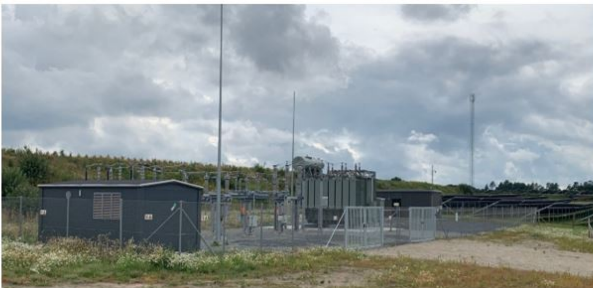
Figur 2.3: Eksempel på step-up transformer.

Transformerens vil have en koblingsstation med en maksimal højde på 4,5 meter og tilhørende udendørs tekniske konstruktioner med master på maksimalt 7 meter, dog kan lynafleder være op til 15 meter. Transformerstationen vil blive særskilt indhegnet med trådhegn efter gældende sikkerhedsregler.