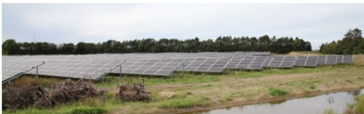
Figur 2.1: Solceller monteret på faste stativer

Solcelleanlægget består af parallelle rækker af solpaneler monteret på stativer. Rækkerne med solceller opstilles parallelt i øst-vestgående retning og alle solcellepaneler vil have ensartet udseende og hældning. Solcellerne er antirefleksbehandlet, hvilket sikrer, at refleksion fra glasset minimeres, hvorved mest muligt sollys trænger gennem glasset og ind til solcellen. Solpanelerne forventes at få en maksimalhøjde på 3 meter over reguleret terræn, afhængigt af endeligt valg af model.