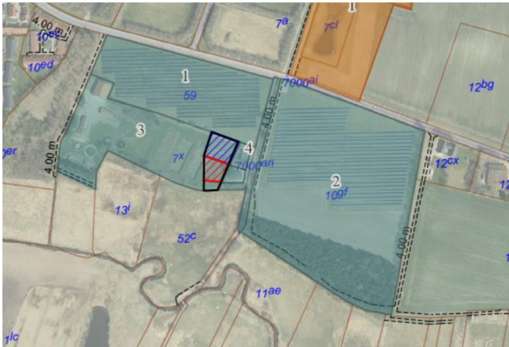
Fig 1.2 Afgrænsning af den ønskede udvidelse af delområde 4 er vist med sort. Udvidelse af byggefelt A er vist med rødskravering, mens udvidelse af byggefelt B er vist med blå skravering.