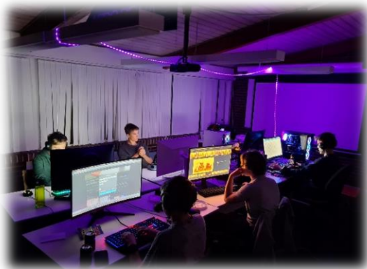
Omskoling til Condor

Der er igen, blandt meget andet, blevet arrangeret jule- og påskefrokost, nytårsfest, Condorflyvning og mange hyggelige fællesspisningsaftener. Disse arrangementer er en uvurderlig og uundværlig del af vores fællesskab.