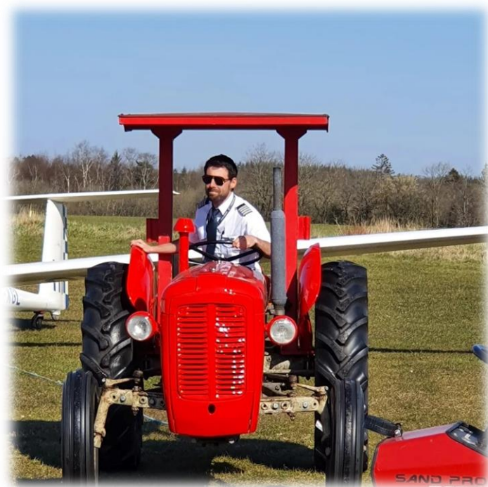
This is your captain speaking ...

En stor tak til alle, som har bidraget med arbejdet og gode råd.