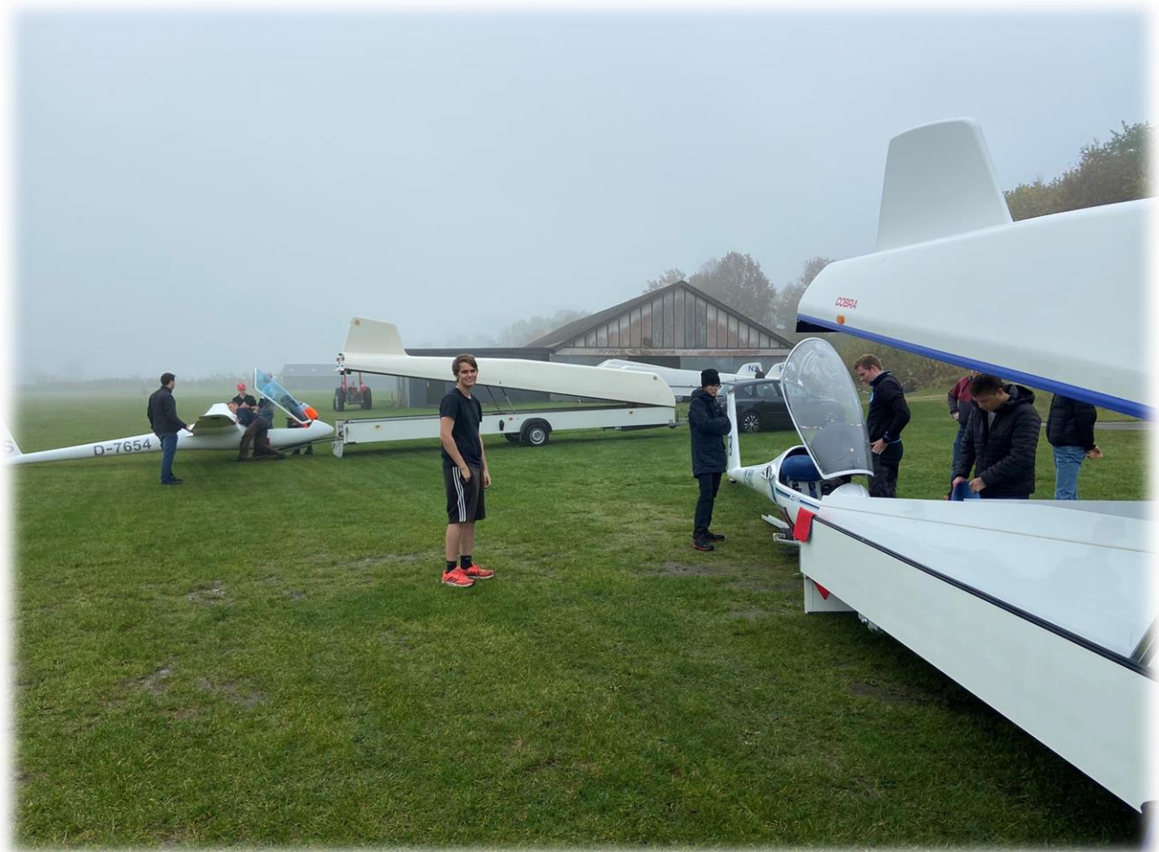
Der løftes i flok

Der er blevet knoklet utallige timer i værkstederne, mange timers undervisning er afviklet i teorilokalet, lange mørke aftener med bunker af papirarbejde, instruktør- og pladsvagter, dage er gået med planlægning og gennemførelse af DIKO og sommerlejre, time ind og time ud på traktoren for at holde banen klippet, tålmodigheden sat på prøve, når wire skulle splejses og masser af sved på panden, for hele tiden at holde vores omgivelser og bygninger i en pæn og ordentlig stand og et utal af timer er brugt i køkkenet.