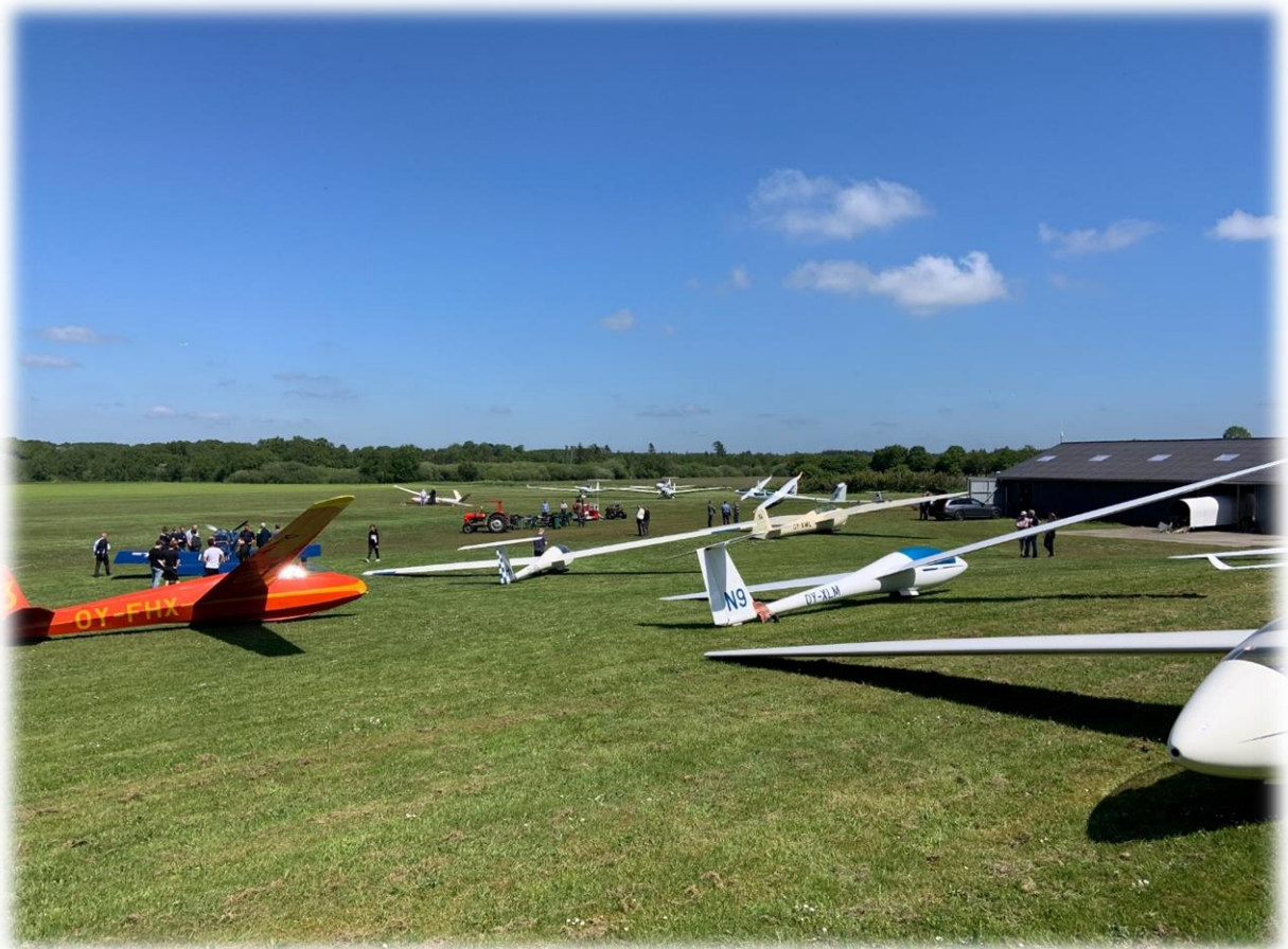
Trængsel på EKHM

Det er langt vigtigere at forholde sig til flyveegenskaber og egnethed til klubbrug. Tiden har vist at alder på fly betyder mindre. Det er vedligeholdelsesstand og flyets egenskaber i form af rorharmoni og ydeevne som tæller når man i dag skal anskaffe fly.