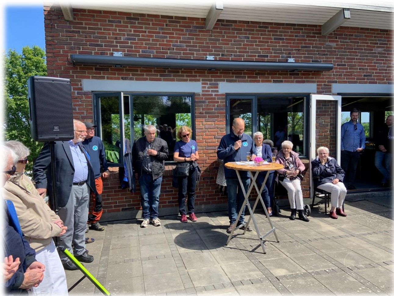
Hammer Flyveplads (EKHM) 50år