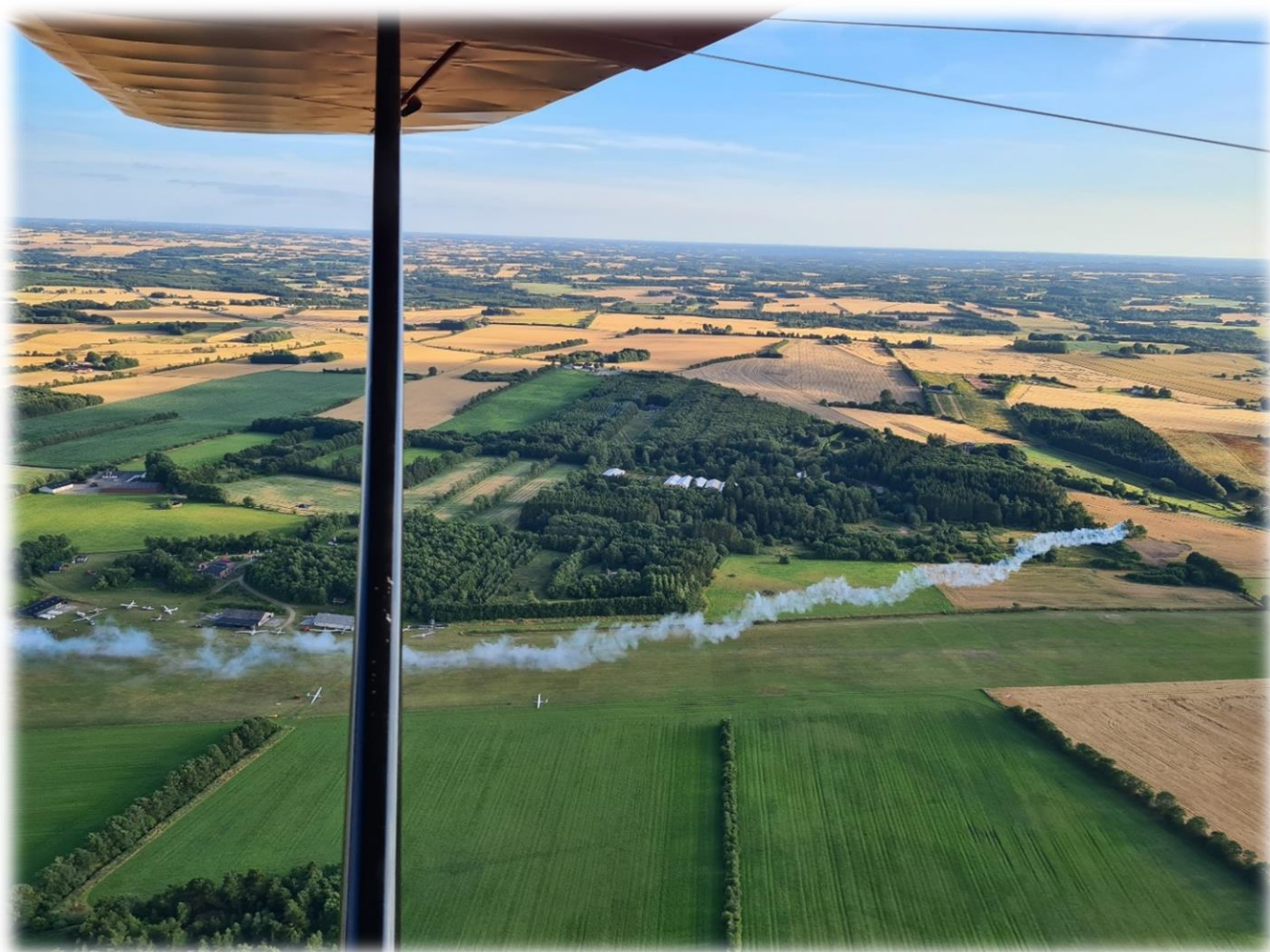
Fly-in 2022: RV8 starter fra Hammer med røg systemet aktiveret set fra 2G