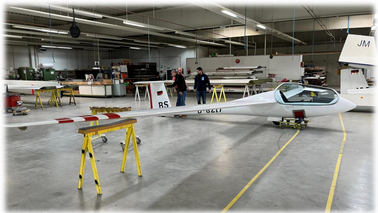
Discus B – D-8217 (BS)

Lige inden pokalfesten holdt bestyrelsen et kort møde, hvor vi besluttede at købe en brugt, men komplet renoveret Discus B fra 1988 og sidst i november ankom D-8217 til Hammer. Vi håber at klubben får stor glæde af det flotte fly mange år frem. Jeg skal lige slutteligt nævne, at flyet er betalt kontant!