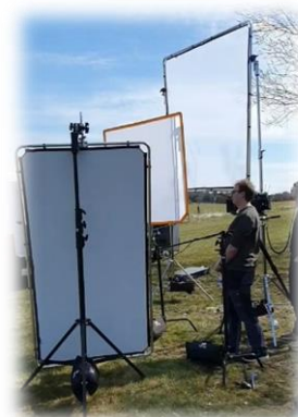
Videoproduktion i gang