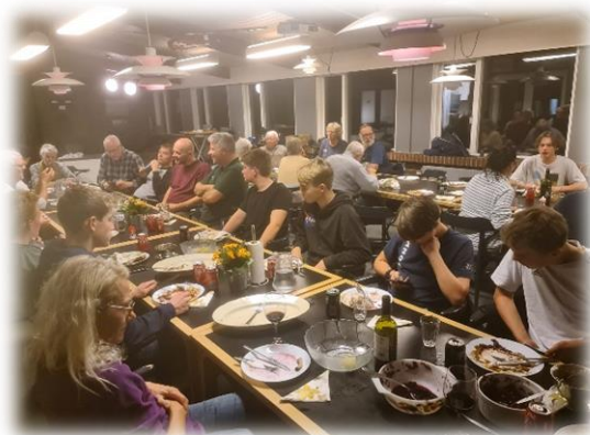
Fællesspisning i Hammershus

Flyvesæsonen 2022 startede som vanligt med den traditionelle standerhejsning og forårstjekseminar, den 5. marts og vejret tillod endda, at vi fik afviklet de første starter.