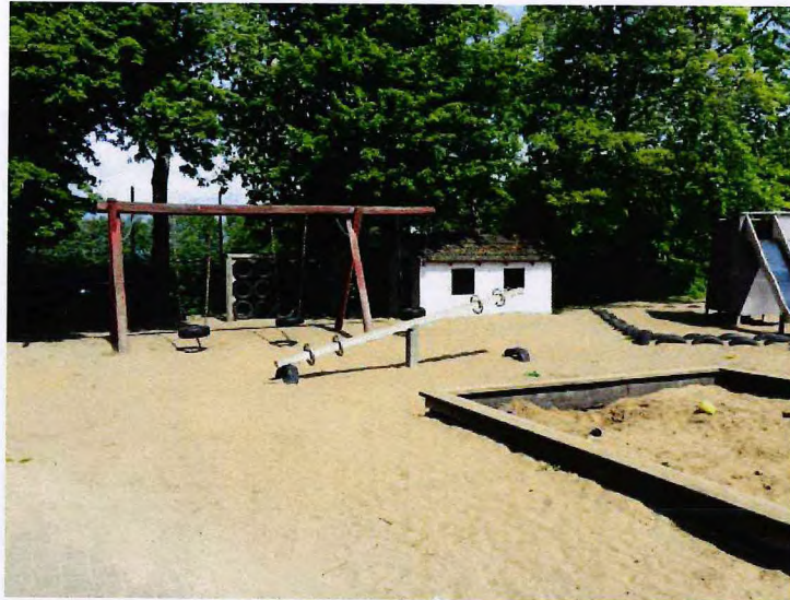
Området, som det ser ud i dag.

Det naturlige samlingspunkt for As sogn er området omkring As Idrætsforening og As Friskole. I dette område arbejdes der på at opføre en plads med mulighed for bevægelse og træning i kraft af et motoriktårn, sansegynge og cross-fit redskaber. Her findes i forvejen fodboldbaner, bålhytte, ny-anlagt multibane og legeplads af ældre dato.