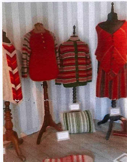
Billedet er fra Glud Museums særudstilling: GEMérnes "Strikkede Olmer-Striber", sommeren 2016.

Vi har tidligere skabt udstillinger med håndstrik i samarbejde med Blicheregnens Museum i Thorning, GiveEgnens Museum, Tønder Kulturhistoriske Museum, Textilmuseet i Herning, Glud Museum samt et par af de jyske Kunstmuseer.