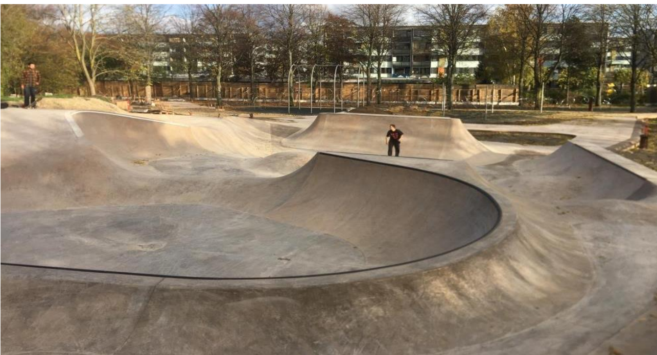
Remiseparken KBH 2019