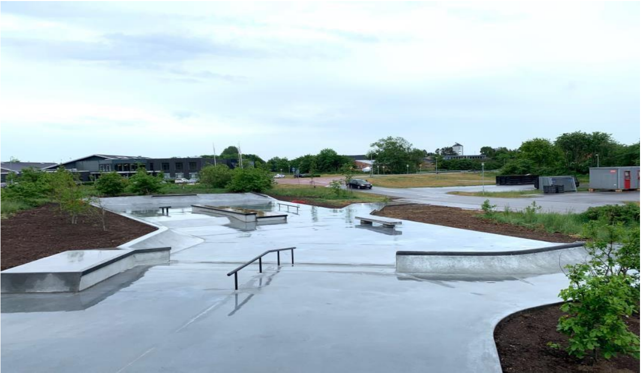
Ribe Skatepark 2020