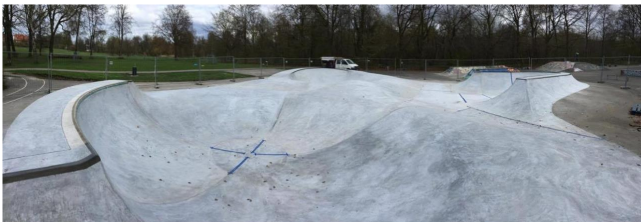
Skt. Jørgensparken Odense 2017

Opgravet jord fra bundsikringsopbygningen, indarbejdes omkring bagsider på ramper i en naturlig terrænopbygning, som passer ind i landskabet.