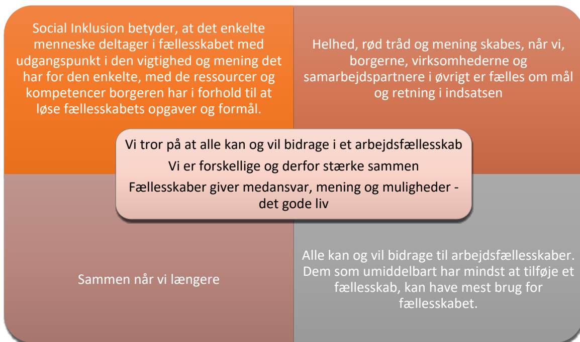
Figur 3 Værdier i indsatsen i Beskæftigelse