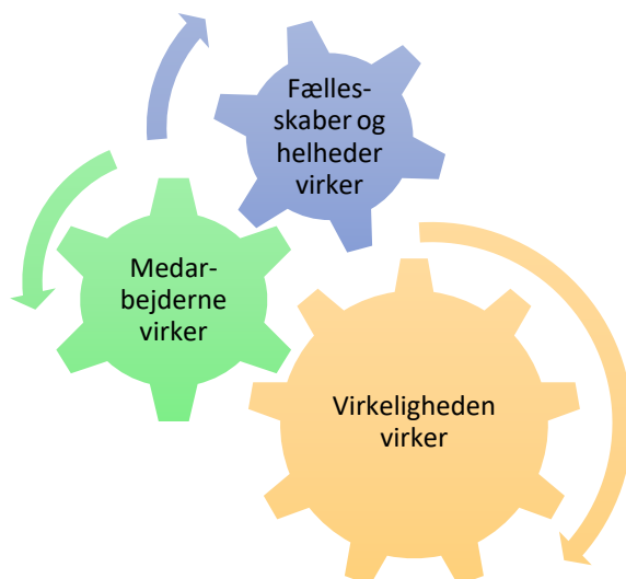
Figur 4 Pejlemærker for indsatser i Beskæftigelse

Der er tre pejlemærker for den virksomme indsats i Beskæftigelse, pejlemærker som er båret af evidensbaseret viden og af erfaringer fra flere års indsatser. 1