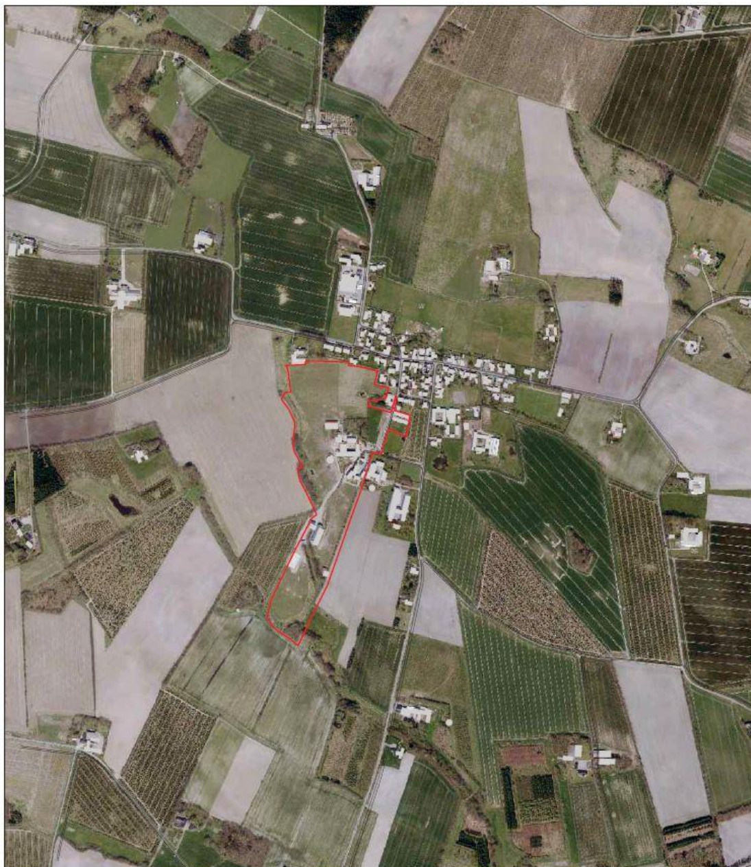
Afgrænsningen af planområdet

Planområdet ligger i udkanten af Hjortsvang. Området omfatter matr. nr. 6k, 4o, 4a og 5a, samt del af matr. nr. 4p alle ejerlav Hjortsvang By, Linnerup og udgør et areal på ca. 12 ha.