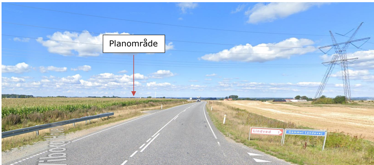
4) Billedet er fra Viborg Hovedvej mod nord og viser landskabet ca. 510 m fra området.