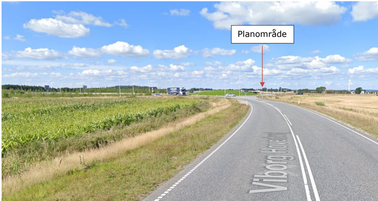
5) Billedet er fra Viborg Hovedvej mod nord og viser landskabet ca. 225 m fra området.