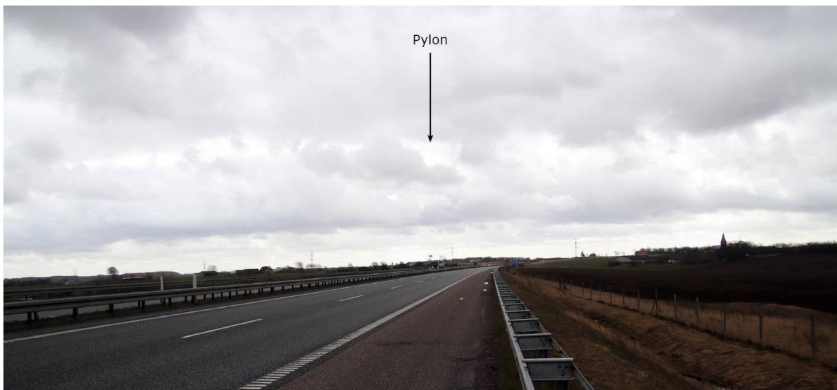
2) Visualiseringen er fra motorvejen mod syd og viser pylonen ca. 980 m fra området.