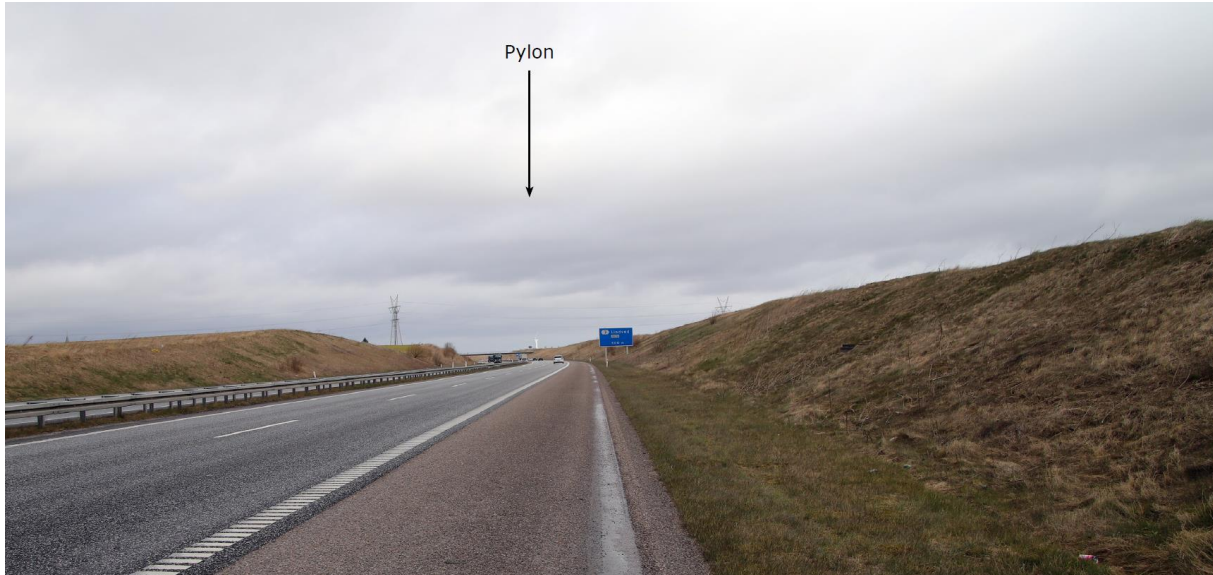
1) Visualiseringen er fra motorvejen mod nord og viser pylonen ca. 1280 m fra området.

Hedensted Kommune vurderer på baggrund af ovenstående redegørelse for landskabet omkring lokalplanen sammenholdt med pylonens udseende, at pylonen er omfattet af undtagelsesbestemmelserne i naturbeskyttelseslovens § 21, stk. 2, pkt. 1.