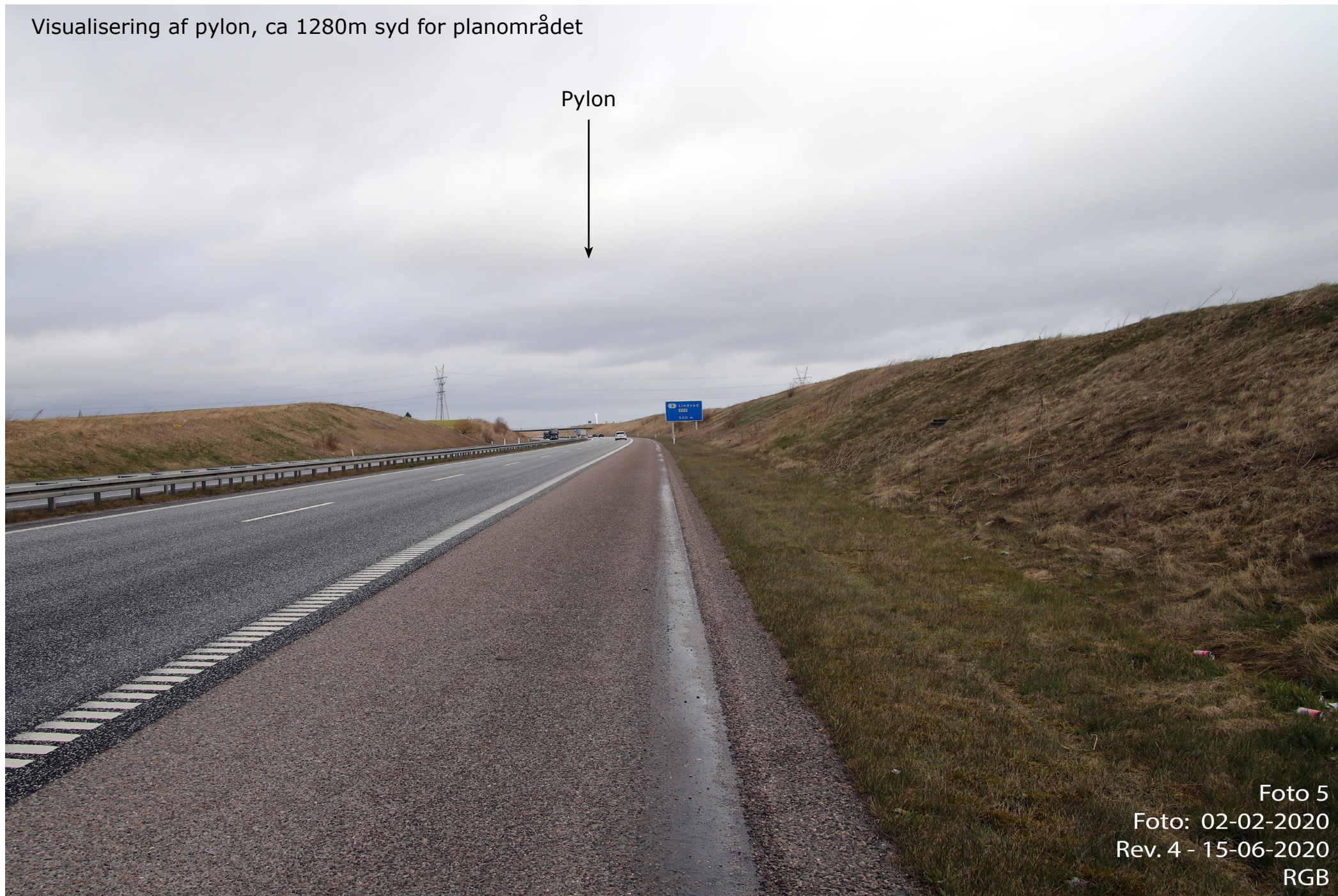
Foto 5 Foto: 02-02-2020 Rev. 4 - 15-06-2020 RGB