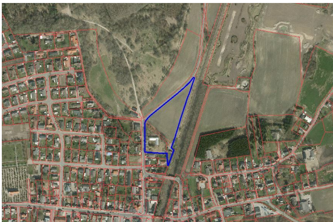
Lokalplanens afrænsning er vist med blå.

I forbindelse med Kommuneplantillæg nr. 25 udarbejdes Lokalplan 1136, som giver mulighed for etablering af et blandet boligområde til åben-lav og tæt-lav bebyggelse.