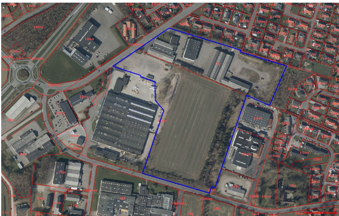
Afgræsning af kommuneplantillæg.

I forbindelse med kommuneplantillæg nr. 29 udarbejdes lokalplan 1151 som sikrer områdets anvendelse til boligområde. Lokalplanområdet er opdelt i to delområder, hvoraf kun delområde I er byggeretsgivende. Delområde II fastlægger rammebestemmelser, der skal overholdes i fremtidige detaillokalplaner. Lokalplanen vil sikre minimering af miljømæssige påvirkninger, grønne fælles fri- og opholdsarealer, veje, stier og parkeringsforhold samt regnvandshåndtering.