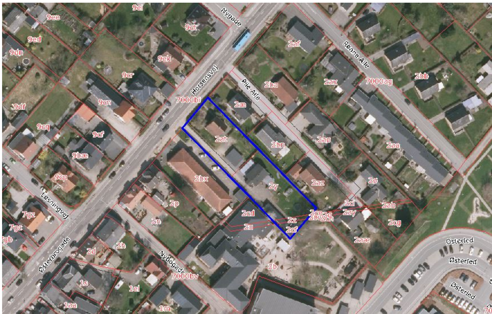
Kortet viser lokalplanafgrænsningen