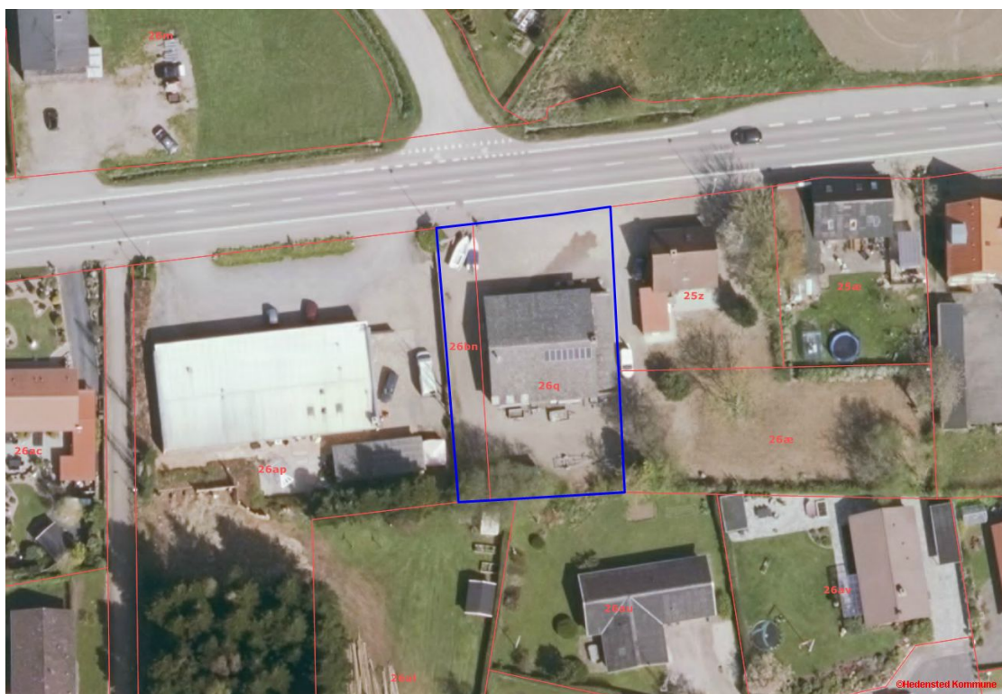
Afgrænsning af kommuneplantillæg

Forslaget er udarbejdet i overensstemmelse med planlovens § 23c. Der er ikke gennemført forudgående indkaldelse af ideer og forslag, idet forslaget alene omfatter mindre ændringer i kommuneplanens rammedel, som ikke strider mod kommuneplanens hovedprincipper samt uvæsentlige ændringer i planens hovedstruktur.