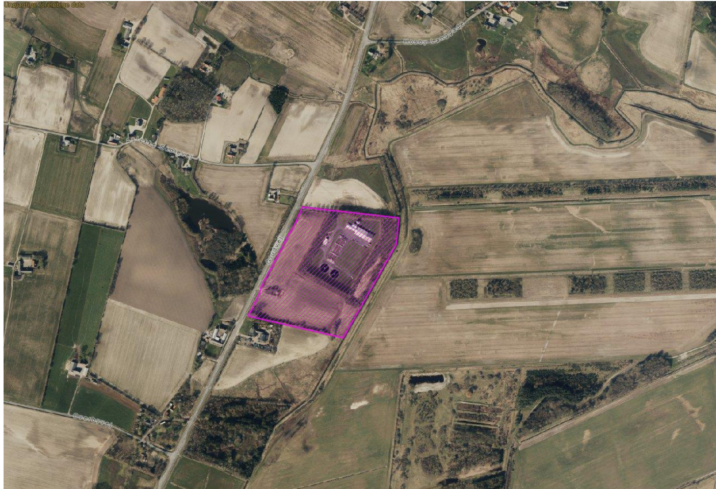
Oversigtskort med planområdet og eksisterende forhold