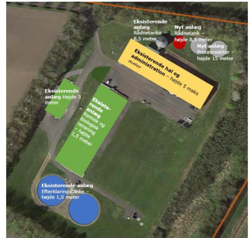
Eksisterende og ny bebyggelse med bygningshøjder