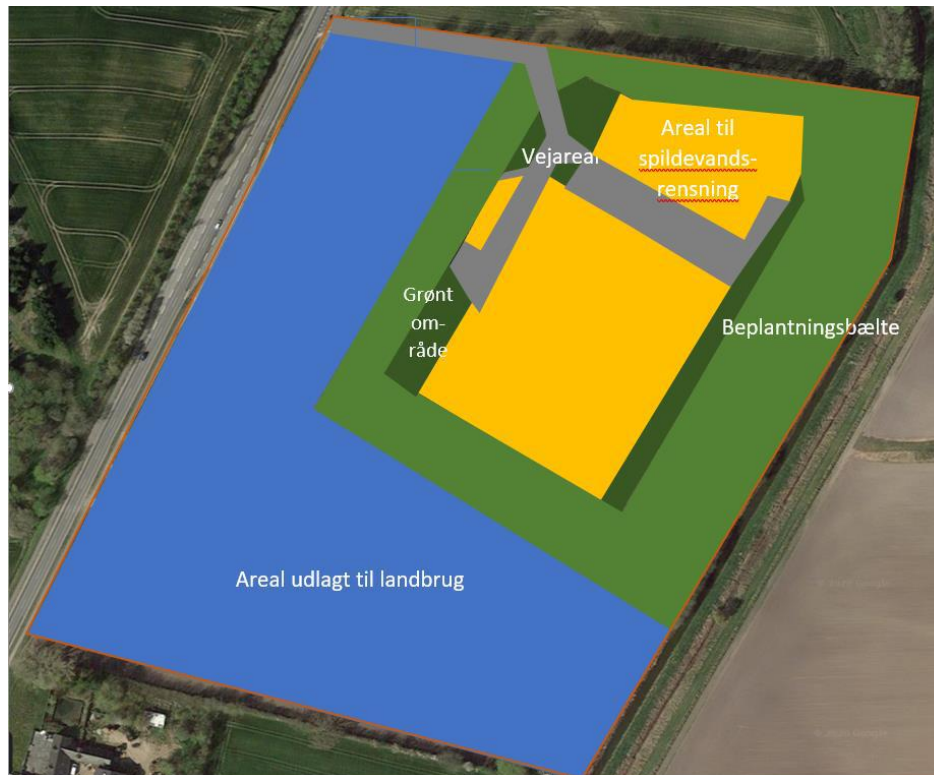
Arealanvendelse hos Juelsminde Renseanlæg

Lokalplanens afgrænsning vil forblive den samme.