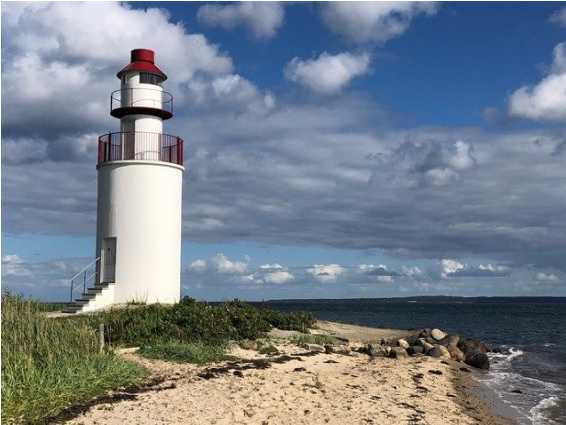
Træskohage Fyr ved Vejle Fjord.