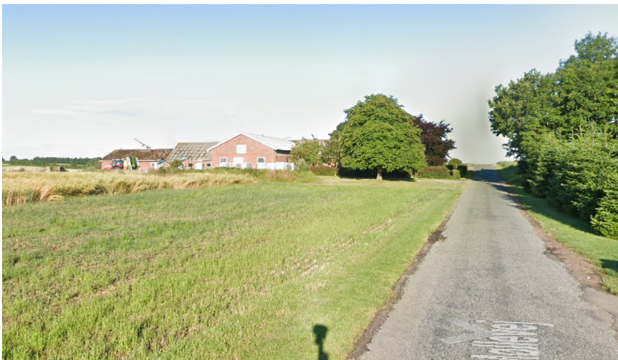
Figur 2. Udsyn fra Gram Møllevej 3, 7130 Juelsminde, hvor maskinhuset vil være skjult af eksisterende bygning.