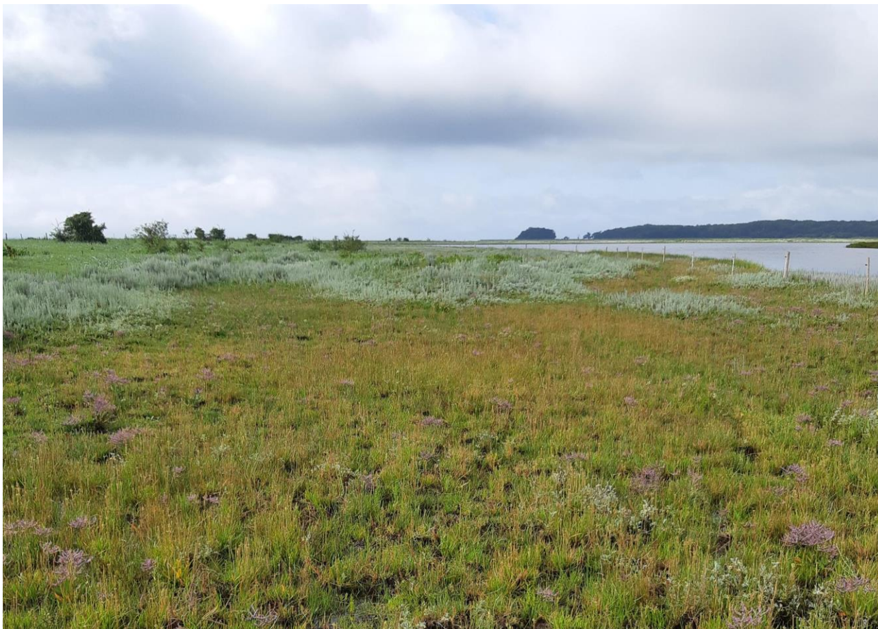
Afgræsset strandeng (1330) i Odder kommune med bl.a. lav hindebæger. Naturtypen strandeng udgør over halvdelen af den lysåbne habitatnatur i Natura 2000-området N56 Horsens fjord, havet øst for, og Endelave. Odder kommune.

Odder Kommune har opsat færdsel forbudt skilte på Alrø, v. holmene. Skiltene er opsat således at færdsel i fuglenes ynglesæson reguleres bedre. Odder kommune har desuden opsat vildtkameraer på holmene, for at kortlægge omfanget af prædation på ynglelokaliteterne.