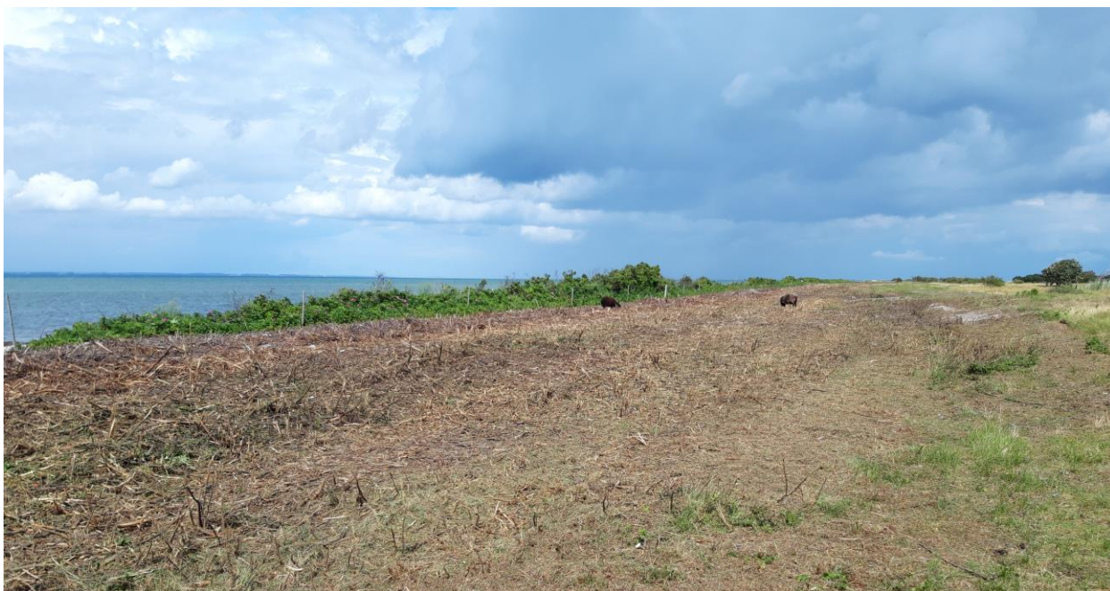
Knusning af rynket rose med efterfølgende afgræsning med gutfår og shetlandsponyer på Øvre. Horsens kommune.

Effekten af indsatserne bliver løbende vurderet i det Nationale Overvågningsprogram for Vandmiljø og Natur (NOVANA), som overvåger vandmiljøets og naturens tilstand inden for de områder, der prioriteres i forhold til de politisk fastsatte økonomiske rammer.