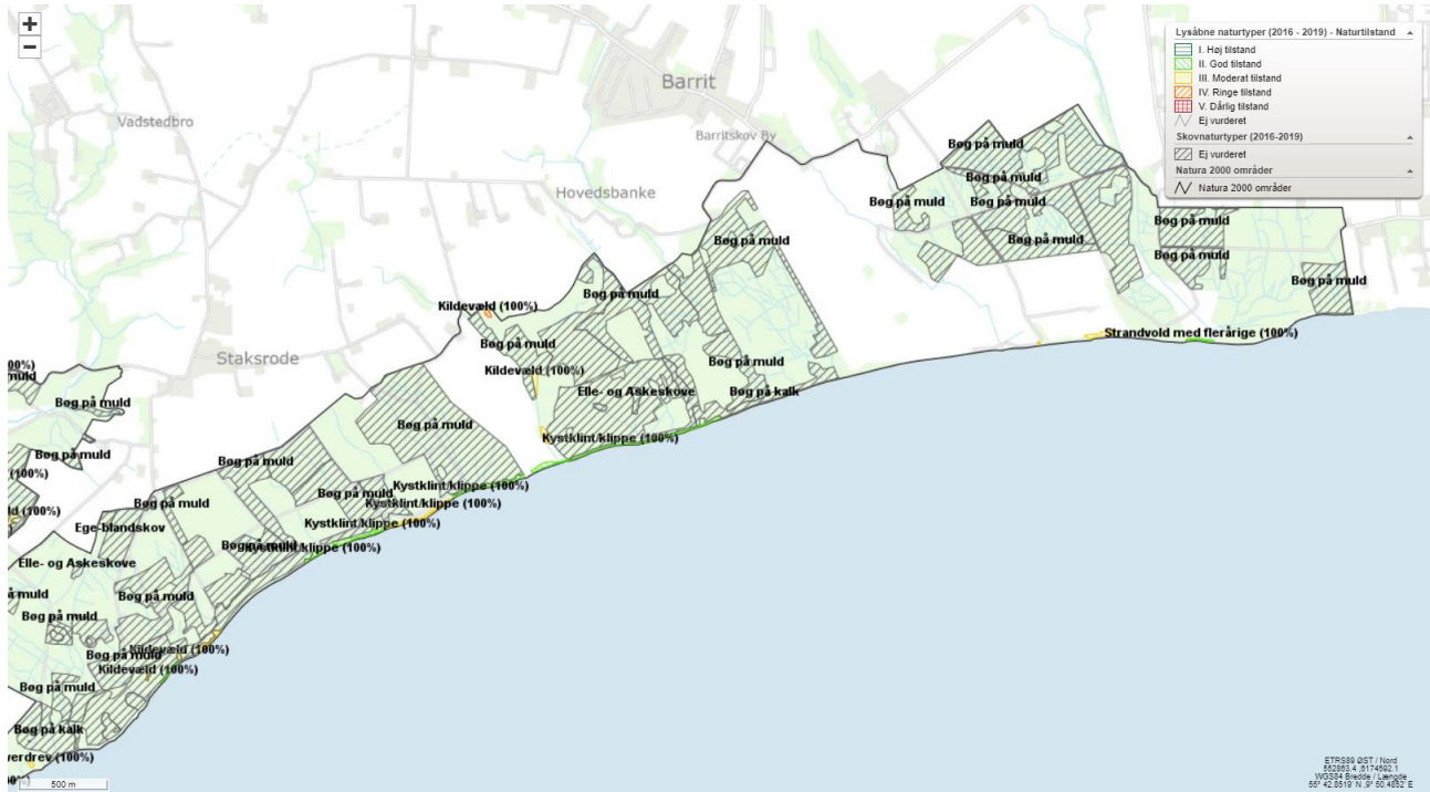
Natura 2000-område N78 Skove langs nordsiden af Vejle Fjord, østlige del: Eskemose Skov, Staksrode Øster- og Vesterskov, Rand Skov, Sønderskov, Barrit Tykke og Klakring Skovhaver.

Herunder er indsat afgrænsning af Natura 2000-området med de kortlagte naturtyper og med angivelse af naturtilstand i fem kategorier (ej angivet for skovnaturtyper). Kort kan ses online på https://miljoegis.mim.dk/spatialmap?profile=natura2000planer3-2022