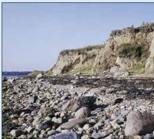
De stejle kystskrænter på sydøstkysten.

Samtidig "æder" havet sig ganske langsomt ind i øens sydøstlige kyst, og efterlader her stejle lerede kystskrænter. Hjørnøs form ændrer sig således konstant – omend det går meget langsomt.