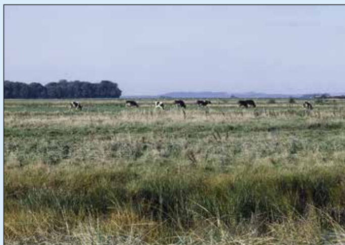
Græssende køer på strandengene, med øens eneste skov i baggrunden.

Størstedelen af øen består af dyrkede marker. Kun ved Hjørnø By, på den nordlige halvdel af øen findes en lille, blandet løvskov. Langs kysten er et næsten sammenhængende bælte af strandenge, som gennem tiderne har været brugt til kreaturgræsning. Levende hegn eller anden beplantning er meget sparsom, så der overalt på øen er god udsigt over landskabet og det omkringliggende hav.