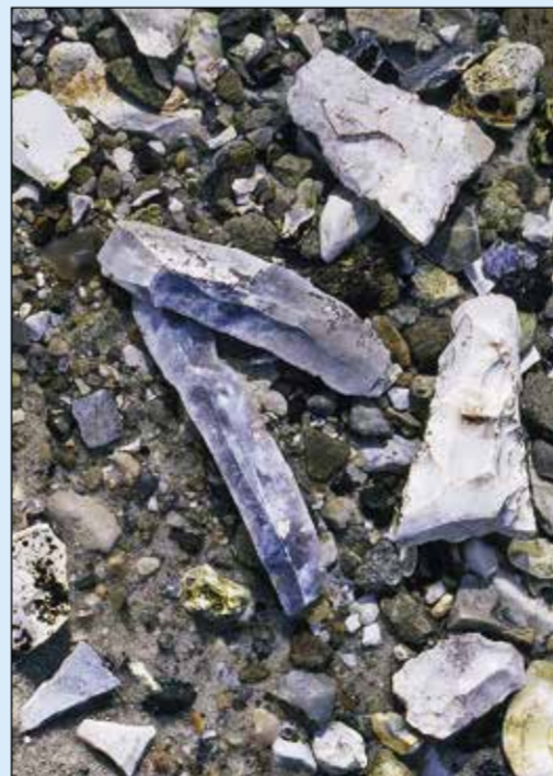
I strandkanten omkring fergelejet opskylles flintredskaber fra ertebøllekulturen – skiveøkser, tværpile og flækker.

På øens højeste sted lå tidligere en stor vandblok kaldet "Kong Hjarne's Sten". Den er nu sprængt og anvendt ved opførelsen af krigsgravene i Fredericia. Om samme sted fortælles, at en tyr engang med sine horn skulle have rodet et gammelt sværd op af jorden. Men ligemeget hvor "man tog det i hus fik man ingen ro", og freden blev først genoprettet, da man atter gravede sværdet ned på dets oprindelige plads.