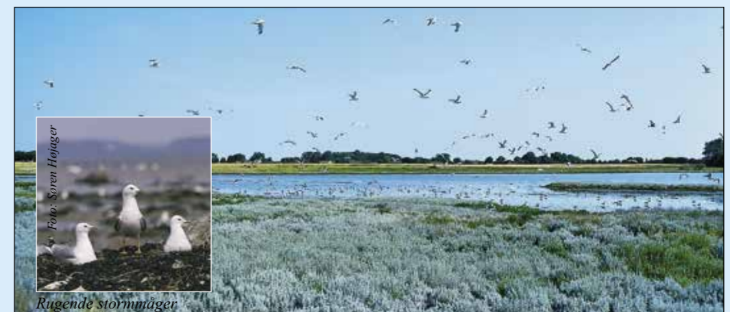
Rugende stormmåger