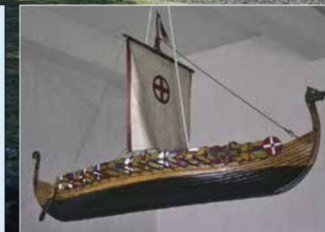
Under loftet hænger der – sikkert med relation til øens vikingetraditioner – en nyere model af et vikingskib. Enestående i en dansk kirke.