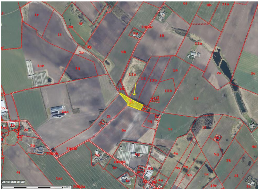
Ejendommens placering i landskabet vist på luftfoto fra 2023.

Afgørelsen vil så vidt muligt blive offentliggjort fredag den 19. april 2024 ved annoncering på Hedensted Kommunes hjemmeside