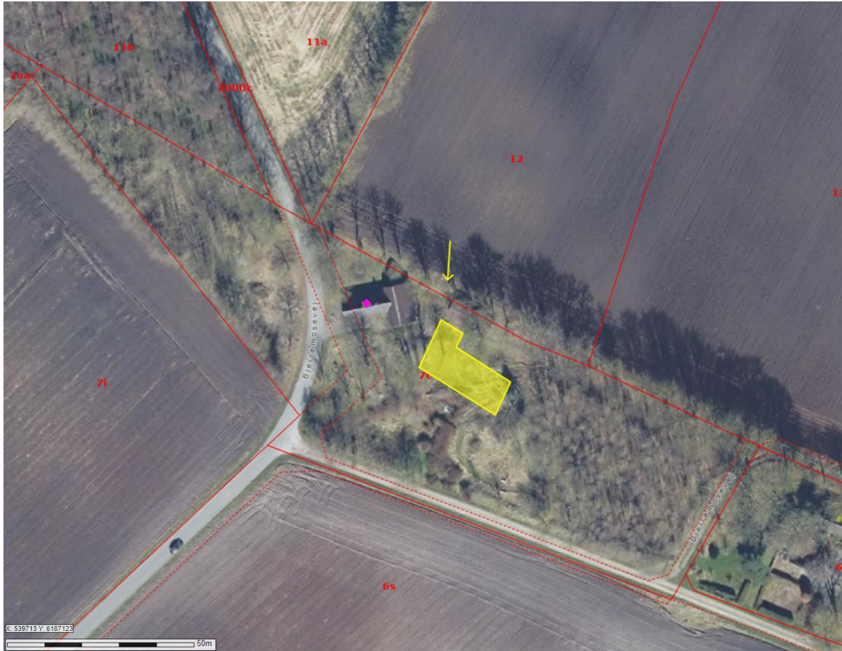
Det ansøgte placering på matriklen, markeret med gul, vist på luftfoto fra 2023.

Ejendommen er registreret med et matrikulært areal på 8.073 m 2 og uden landbrugspligt. Der blev i 2024 meddelt tilladelse til nedrivning af et enfamiliehus og udhus med et samlet areal på 159 m 2 .