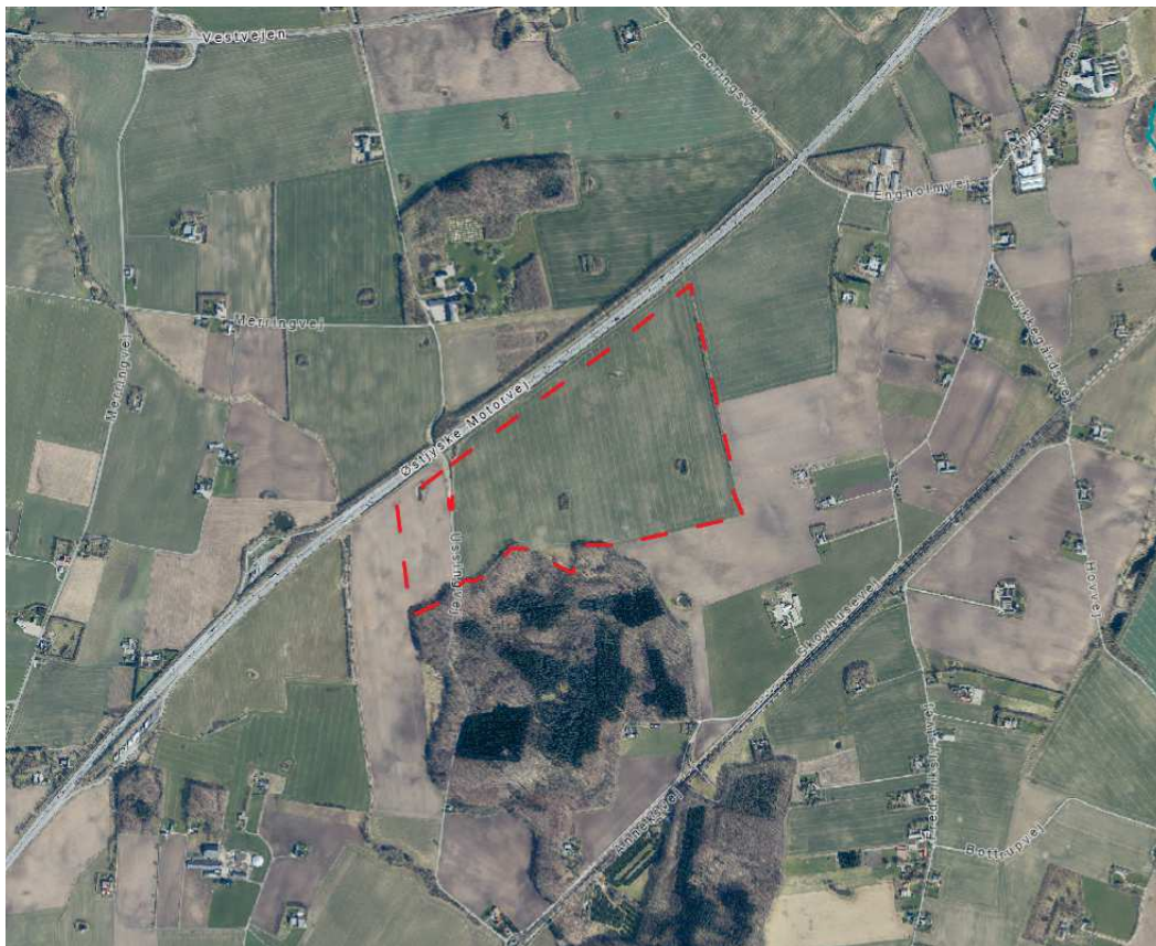
Figur 1: Projektområdets afgrænsning.

Det samlede projektområde er cirka 50 hektar, hvoraf der bliver opstillet solceller på cirka 46 hektar. Området ligger langs den østlige side af Østjyske Motorvej ved Ussinggaard Sønderskov og Anneksskov. Projektområdets afgrænsning fremgår af figur 1.