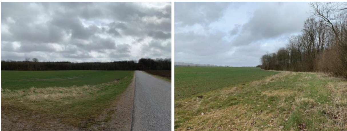
Ansøgers indsendte fotos af eksisterende indsigt til skovbrynet set fra Ussingvej

Solcelleanlægget vil blive etableret med en skærmende beplantning. Placeringen af anlæg på grunden forudsætter ikke rydning af skov og påvirker ikke skovbrynets natur, idet der udlægges en bræmme på 30-50 meter imellem anlægget og skoven. Bræmmen udgør samlet ca. 3,5 ha og formålet er at bevare indkig omkring skovbrynet, samt sikre levesteder for dyr og planter i skovbrynet.