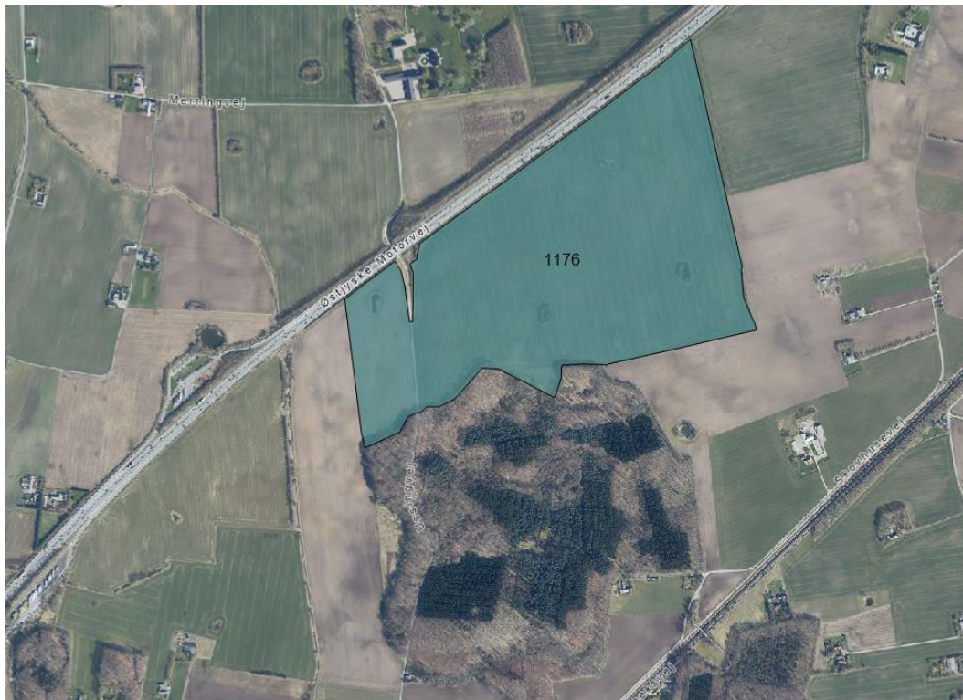
Arealet for lokalplan 1176, markeret med grøn skravering og Ussing Skov syd for lokalplanområdet ses på luftfoto fra 2023.