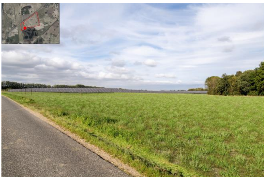
Ansøgers indsendte visualisering af solcelleanlægget uden afskærmende beplantning.