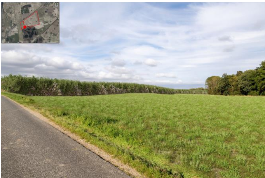
Ansøgers indsendte visualisering af solcelleanlægget med afskærmende beplantning