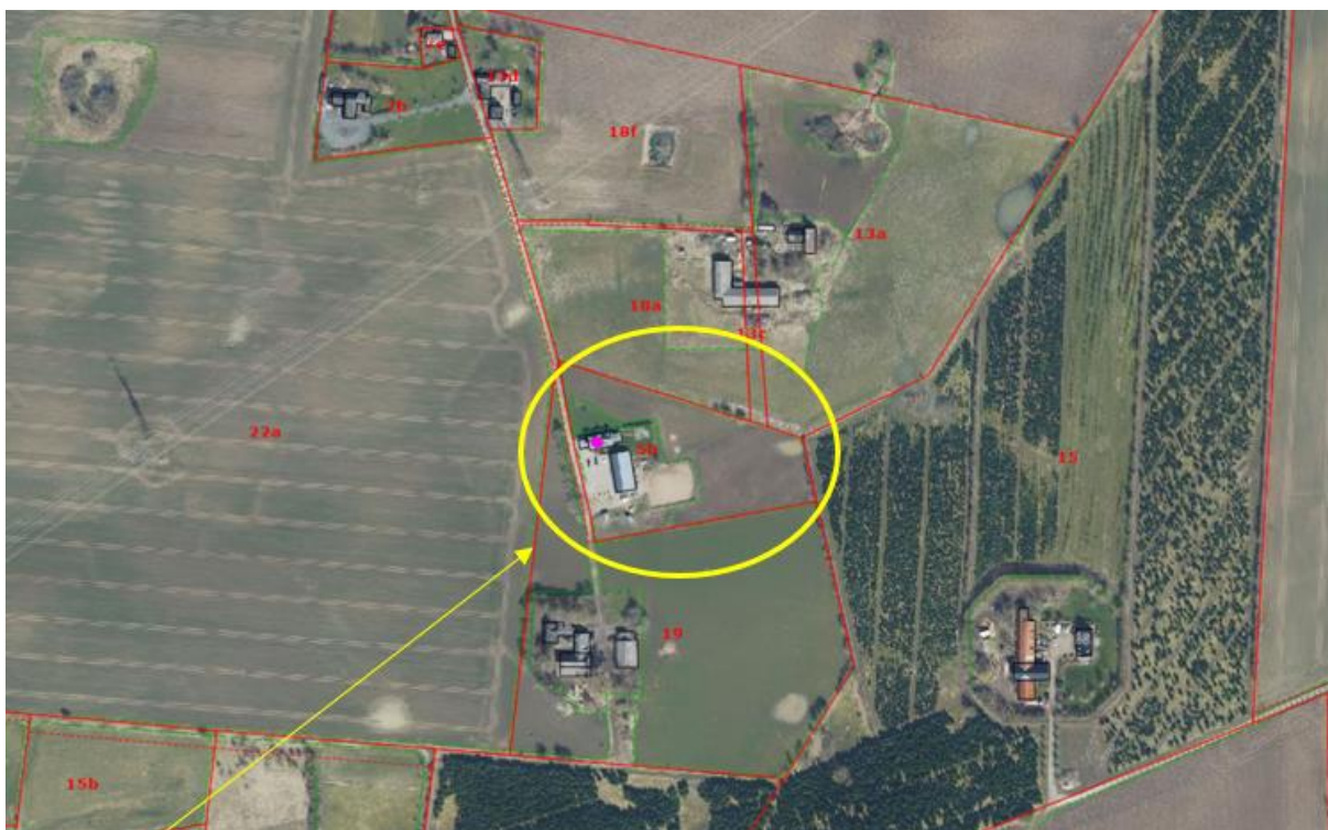
Luftfoto af ejendommen fra 2023.